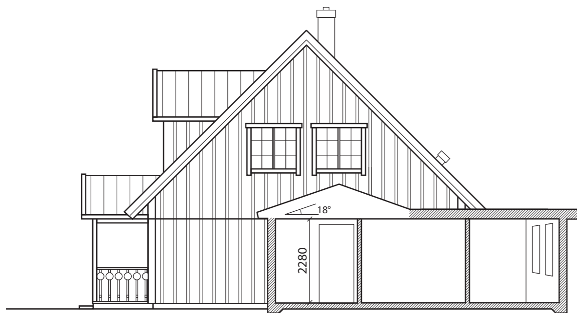
SEKTION A - A