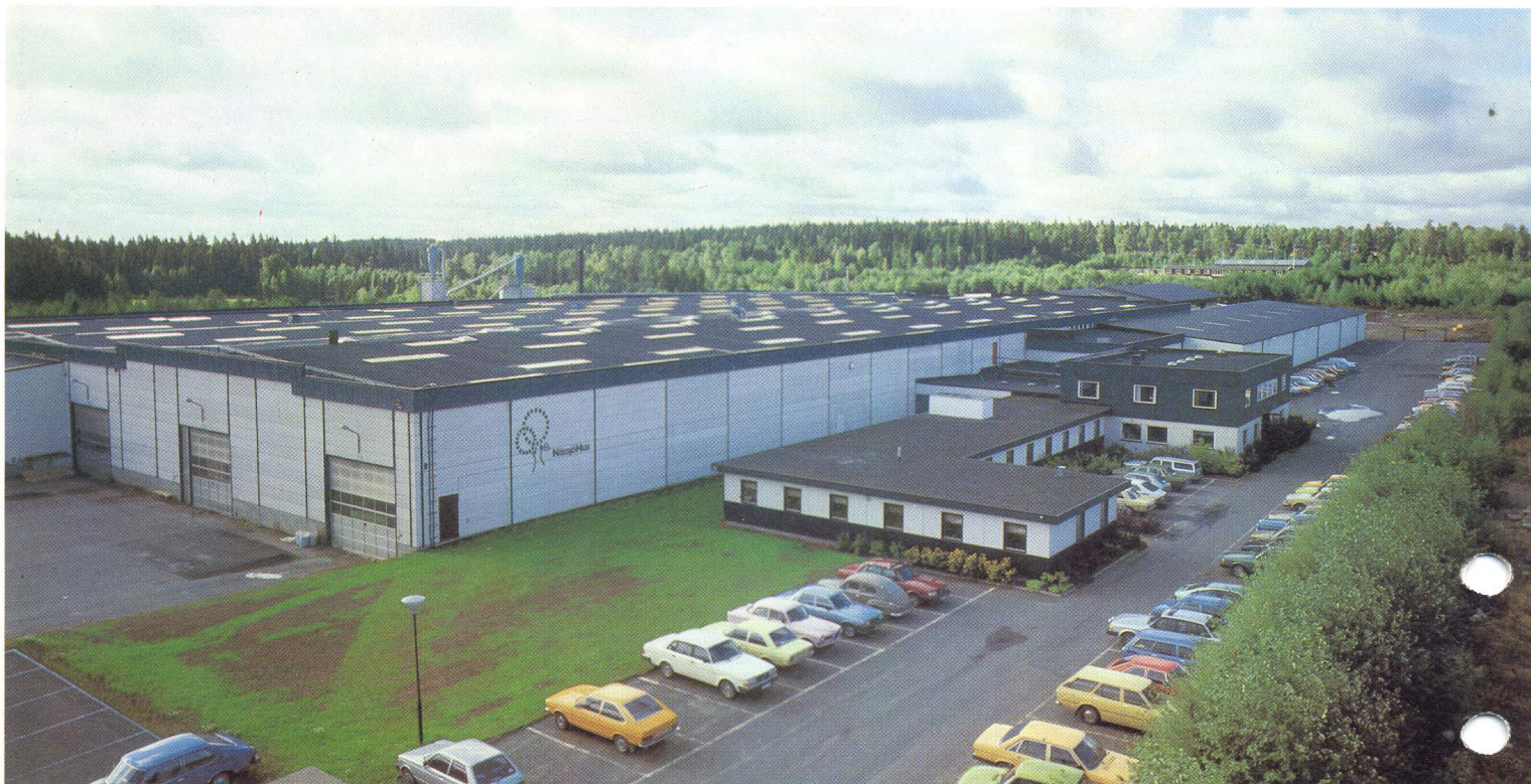
Fabrik och huvudkontor i Nässjö.