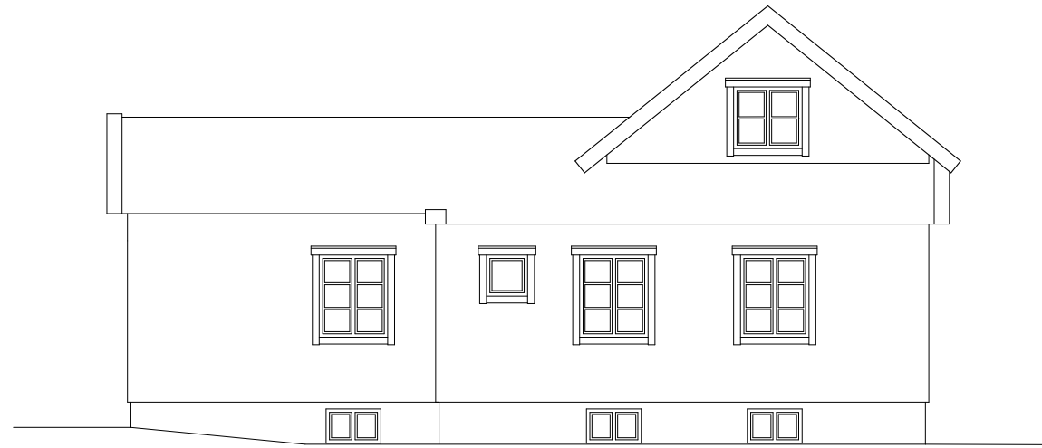
Fasad mot nordost