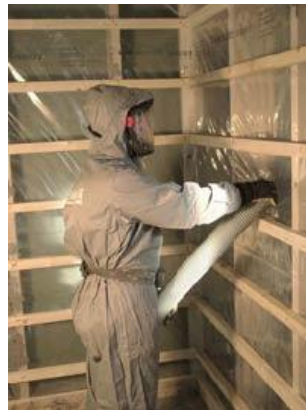
Figur 3. Installation av cellulosafiber i en träregelvägg [3].

Isoleringen kan installeras på träreglar, utvändigt vindskydd, invändigt vindskydd eller plastfolie, glesregling invändigt och spikreglar för utvändigt panel är monterad (Ekofiber).