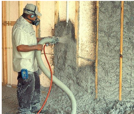
Figur 4. Fuktad cellulosafiber som sprutas på insidan av ytterväggen [4].

För att kunna installera fuktad cellulosafiber ska träreglar och utvändigt vindsydd vara monterat . Den fuktade cellulosafibern installeras direkt på väggen från insidan av byggnaden. Till detta används en sprutmaskin anpassad för fuktad cellulosafiber som med hjälp av tryckluft sprutar isoleringen på plats.