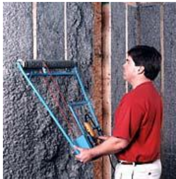
Figur 5. Överflödigt cellulosafiber hyvlas bort [5].

Efter att önskad tjocklek har uppnåtts med cellulosafibern ska överflödigt isolering tas bort och ytan jämnas till. Detta görs med en maskin, en så kallad ”stud scrubber”, som hyvlar av överflödigt cellulosafiber. Isoleringen som hyvlats bort kan sen återanvändas.