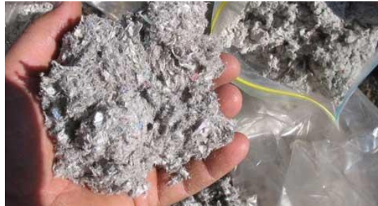
Figur 2. Cellulosafiber [2].