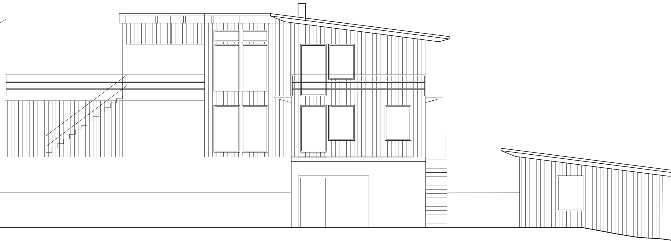
FASAD MOT SÖDER SKALA 1:100