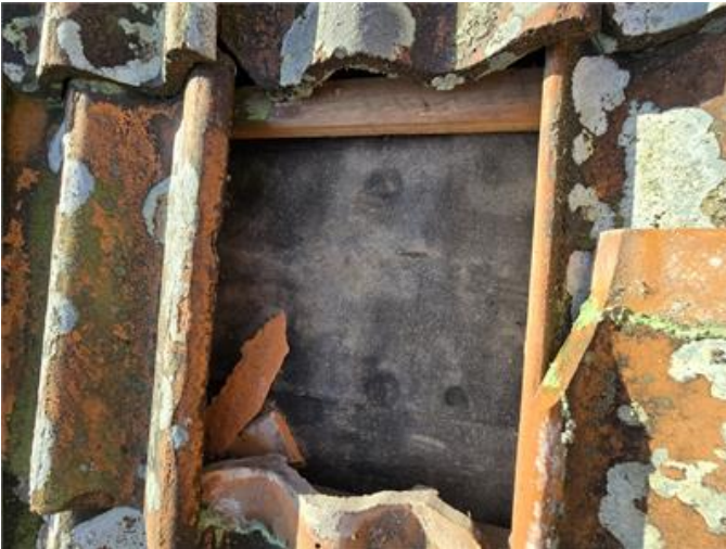
Tak: Stickprovskontroll under lertegelpannor, pappan äldre och spröd.