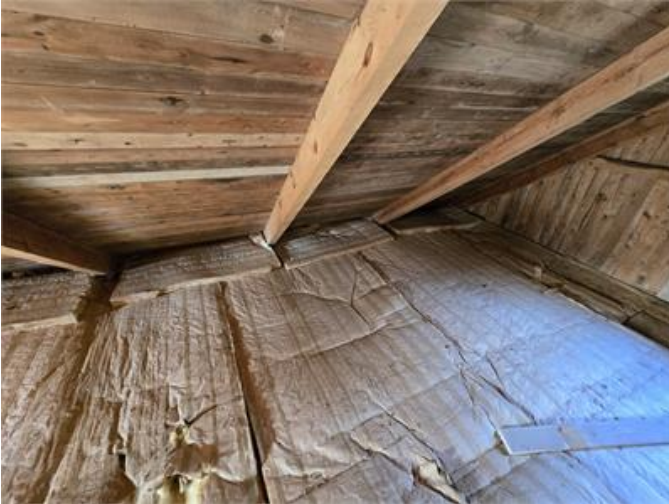
Nockvind: Mikrobiell påväxt/missfärgningar på underlagstak, isolering ligger an mot takfot.