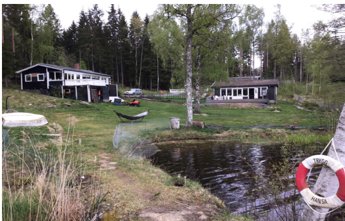
3:45 från bryggan.