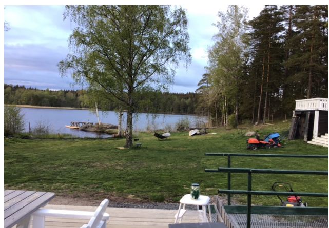
3:45 från det totalrenoverade huset

Anser det direkt felaktigt, rena påhopp, att kräva att jag ska ta bort staket som jag har för mina djur. Om jag inte hade servituten kunde man satt upp grindar. Men ta bort staket? Vill inte heller släppa in allmänheten på min tomt. Dels för att fastigheten redan är undantaget strandskyddet, samt att jag som fastighetsägare har rätt till en frizon, vilket är min hemfridzon. Jag anser inte att jag ska behöva ha allmänheten 5- 10meter från min fastighet.